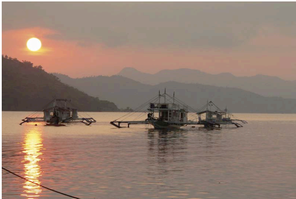
Ph. Claudio Salerno